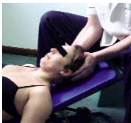
Fig.1: nella prima fase del lavoro successivo al trauma è possibile intervenire attraverso dolci tecniche manuali dette "miotensive", utili per ridurre l'entità dello spasmo muscolare e preparare al successivo lavoro di riequilibrio delle tensioni muscolari.

La parola al paziente: "tutti questi problemi per un vecchio colpo di frusta? Incredibile!"