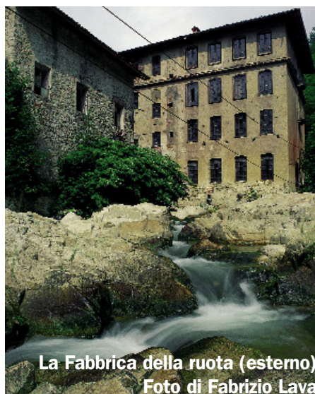
La Fabbrica della ruota (esterno)

d'epoca e oggetti che hanno caratterizzato l'industria tessile. Presso la fabbrica è possibile sperimentare fisicamente l'arte laniera attraverso i corsi di filatura e di tessitura manuale tenuti da personale qualificato con attrezzatura ricostruita su modelli d'epoca.