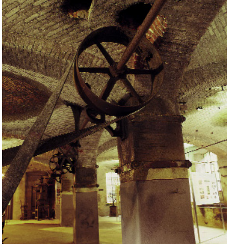
Allestimento interno

Nella fabbrica vengono allestite ogni anno mostre temporanee e sono programmati convegni su argomenti relativi al tema del patrimonio industriale. Oltre mille classi scolastiche hanno scelto, negli ultimi anni, l'ex lanificio Zignone come luogo simbolo per affrontare il tema della rivoluzione industriale o come offerta didattica specifica in relazione alle mostre allestite dal DocBi. Oltre venticinquemila tra bambini e ragazzi, del Biellese e non, hanno seguito le guide in un percorso attraverso ambienti, macchinari