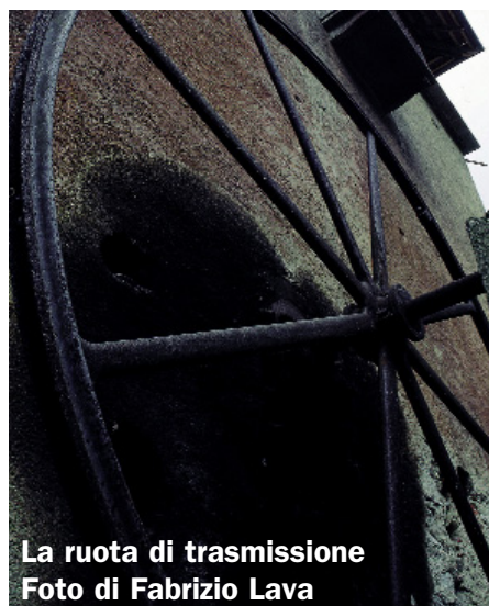
La ruota di trasmissione

Da A26: casello Romagnano-Ghemme, direzione Serravalle, bivio a sinistra per Crevacuore, Pray, poi seguire verso Ponzone.