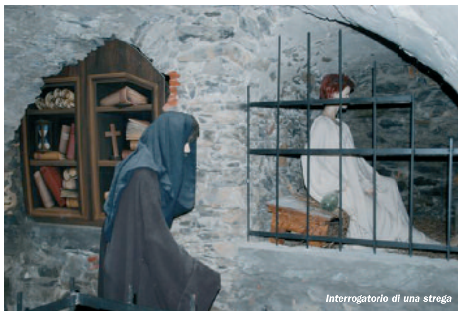
Interrogatorio di una strega

Nel vecchio Municipio di Triora ha trovato collocazione il museo regionale etnografico e della stregoneria, vanto del borgo medievale. Ideato nel 1960 dal Padre Francesco Ferraironi, che per primo, rendendosi conto degli antichi usi che stavano scomparendo, ne intuì la necessità e la potenzialità, allestendo nell'oratorio di San Giovanni Battista un'incredibile mostra popolare, venne ripreso dalla Pro Triora con una prima raccolta di oggetti ed attrezzi, messi a disposizione di alcuni paesani. La spinta decisiva venne però dai ragazzi del Campo Eco del comune di Genova che con grande entusiasmo si dedicò all'iniziativa, riuscendo a coinvolgere gli abitanti, dapprima restii a privarsi dei loro oggetti. Armati di buona volontà, i giovani studenti allestirono le prime sale, suddividendo il numeroso materiale in modo organico e sistemandolo per "cicli". La parte etnografica vera e propria è stata ed è tuttora divisa in sei sale, rappresentanti ognuna uno "spaccato" di vita quotidiana. Al piano centrale, nella sala grande, gli attrezzi utilizzati dai contadini, dai mulattieri, dai falegnami e dei panettieri testimoniano la dura vita dei campi ed il ciclo del grano. Un grosso bove è intento ad arare i